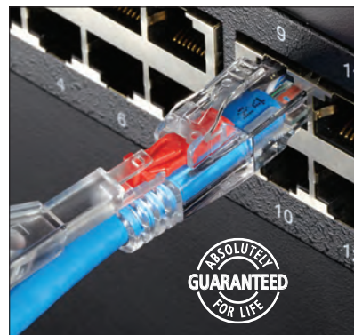
ピンを抜き、キーを持ち上げて、解除します