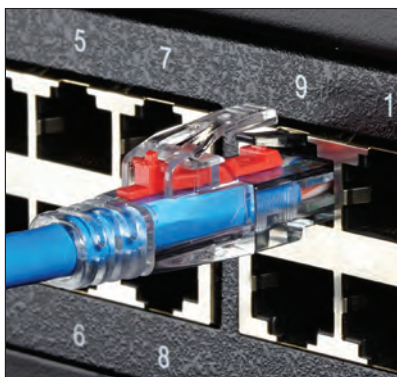
ピンをブーツに差し込んだ状態のロックダウンケーブル

ネットワークポートを保護するには、ロックピンを特許技術のブーツにあるロックタブに差し込みます。一度差し込むと、キーロック解除用ツールがなければ解除できません。