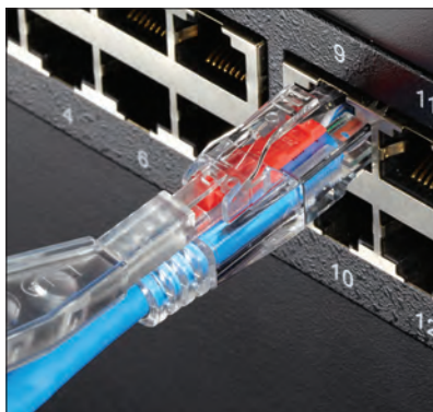
解除するには、カチッと音がするまでキーをピンに差し込みます